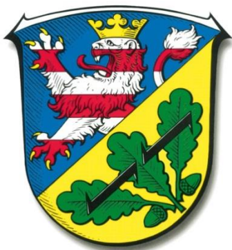
Landkreis Kassel Fachbereich Jugend